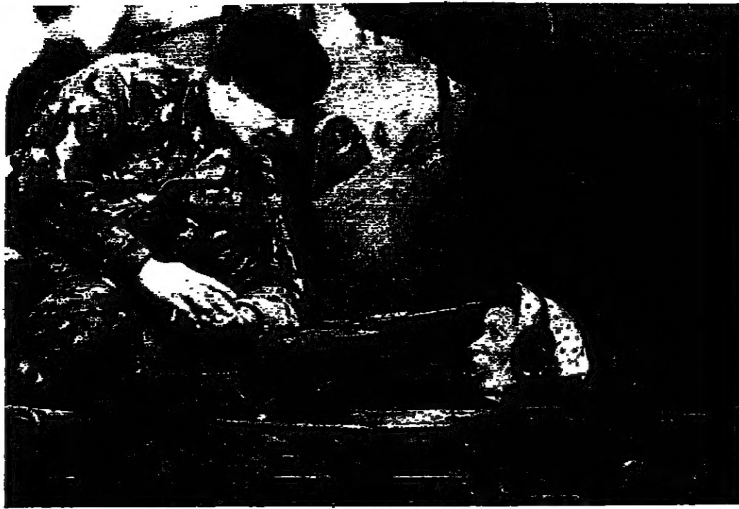
تستوضح اشكالات اداء دجلة شيطان، قبل التوجه الى حقل النار